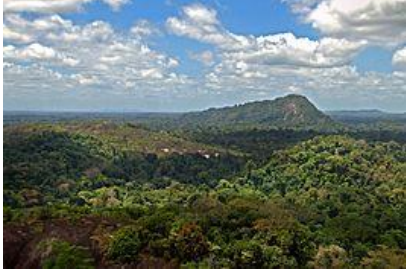
Op de Voltzberg in het natuurreservaat