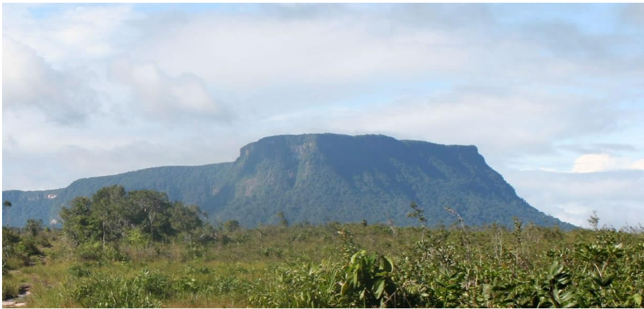
Het Tafelberg natuurreservaat