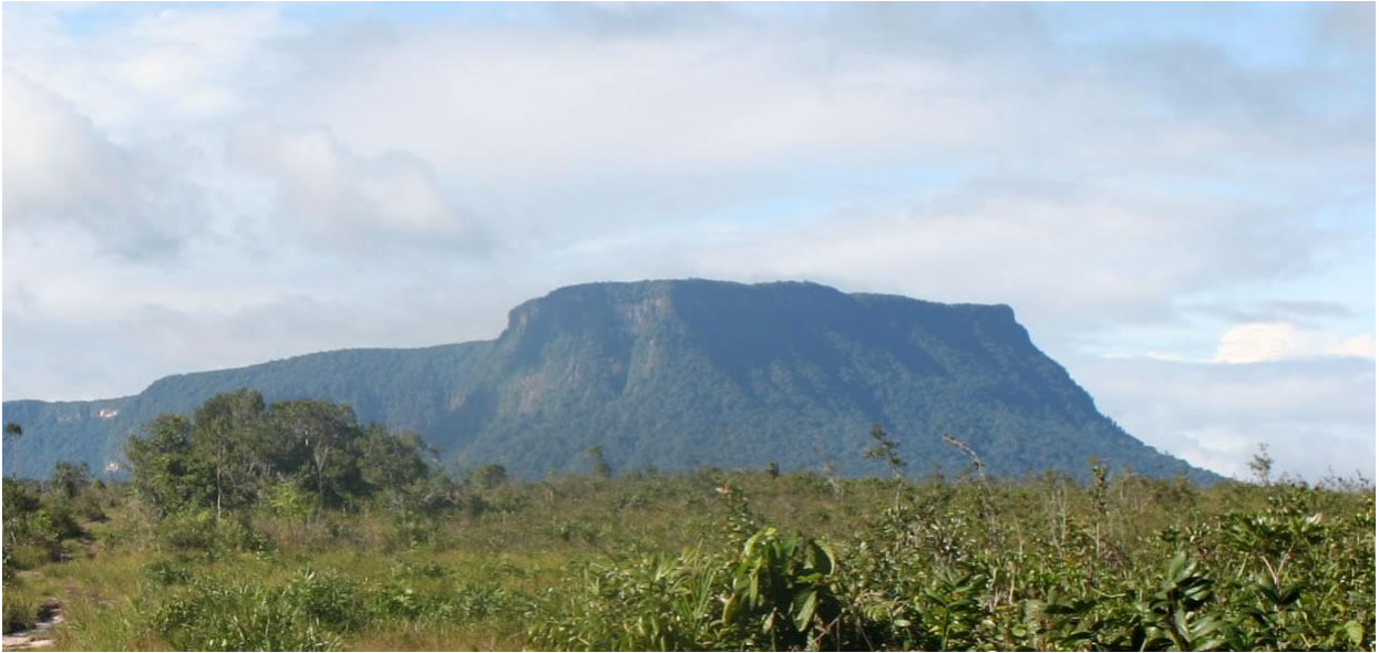
Het Tafelberg natuurreservaat